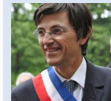
Rencontre avec le député maire de Versailles le 15/10/2013 à Versailles.

La FFB Yvelines est le porte-voix des demandes et propositions de la profession du Bâtiment des Yvelines !