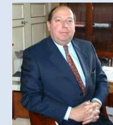
Rencontre avec le préfet Michel JAU, le 26/2/2013 à Versailles.