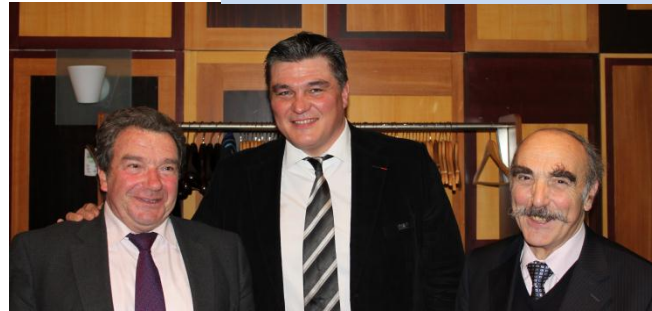
Cérémonie des Vœux 2013

de redécouvrir ces lieux chargés d'histoire.